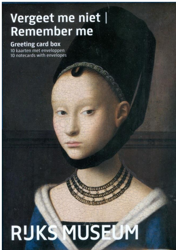
Voorzijde omslag mapje.