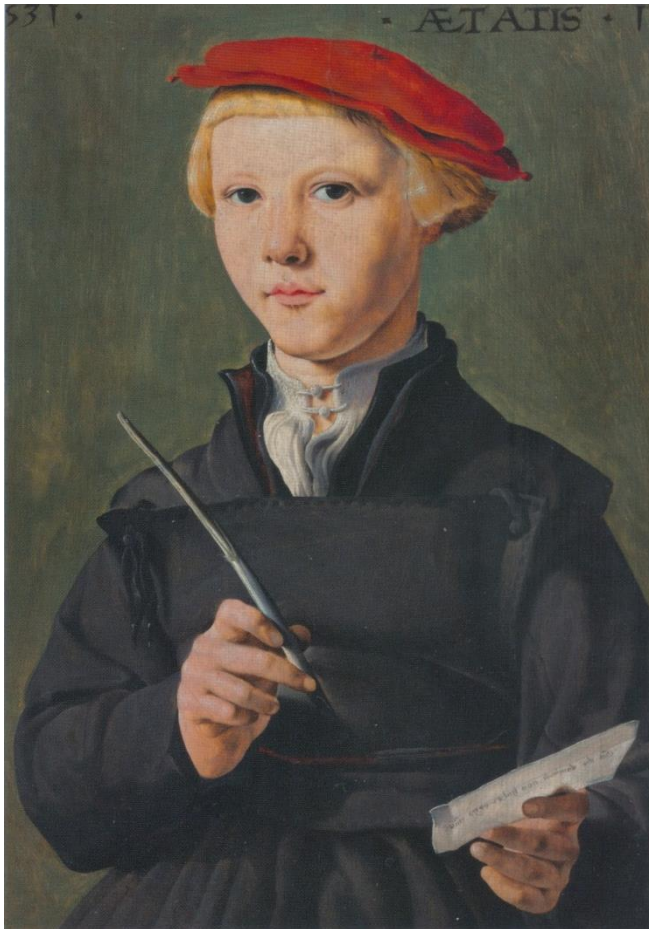
Prentbriefkaart van de tentoonstelling Vergeet me niet.

Van de zeven prentbriefkaarten in mijn bezit, zijn er drie ook afgebeeld op het mapje van de dubbele kaarten en vier niet. Op vier kaarten zijn kunstwerken van andere musea afgebeeld. In het postzegelvak staan de nummers PC776, PC778, PC780 en PC 782. Drie kaarten zijn uit de eigen collectie: W14048, W16785 en één zonder nummer. De titels van de drie prentbriefkaarten en overeenkomstige dubbele kaarten komen op één na overeen. Bij deze dubbele kaart is ook de vermoedelijke naam van de afgebeelde persoon vermeld: Christophe le More?, maar niet op de prentbriefkaart.