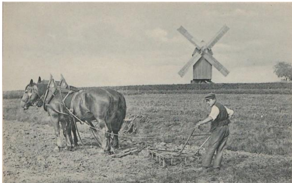
The Knights Series No. 721.