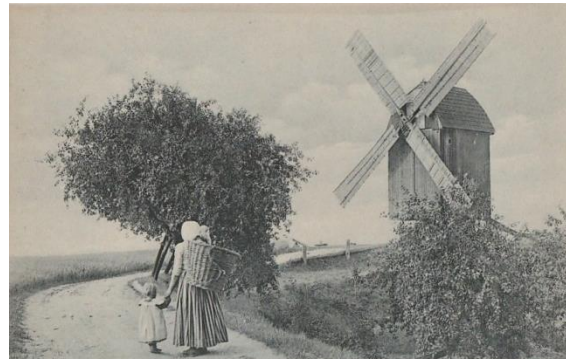
The Knights Series No. 722.