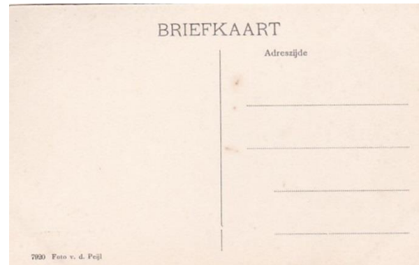
4. Adreszijde Drukker Gebr. van Straaten, Middelburg.

Pieter Oele zal zelf ook nog kaarten uitgegeven. Op de adreszijde staat Uitgave P. Oele Restaurateur. Je kon er blijkbaar ook slapen, want in de geschreven tekst staat: “We zitten al zalig buiten achter het aan o.z. café. We hebben hier n.l. gemaft vannacht die vier ramen boven was onze kamer”.