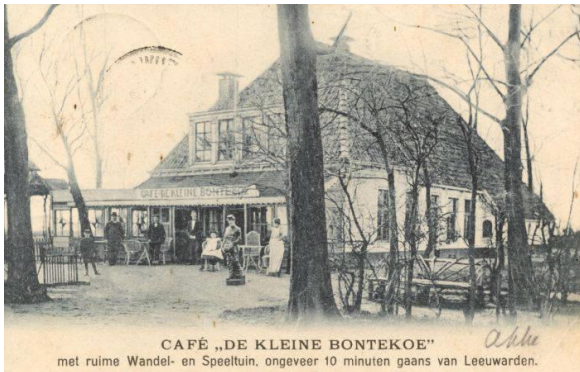
1. Café „De Kleine Bontekoe”