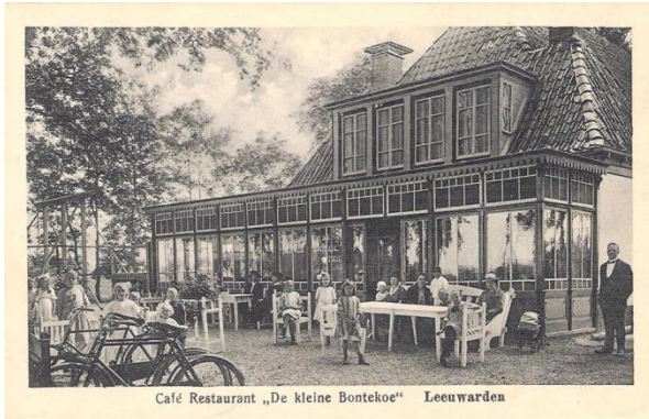
5. Café restaurant „De kleine Bontekoe“ Leeuwarden.