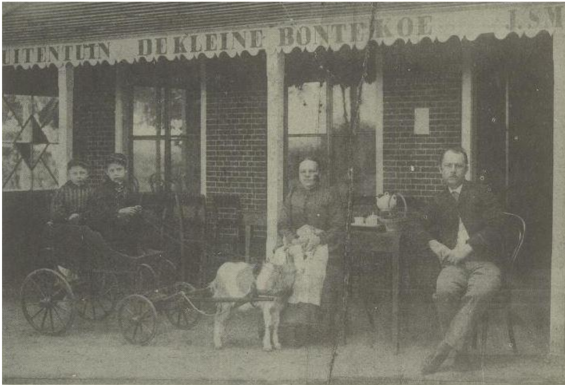
Foto van De Kleine Bontekoe met Buitentuin

Uit 't Kleine Krantsje van 12 juni 1976 pag. 11