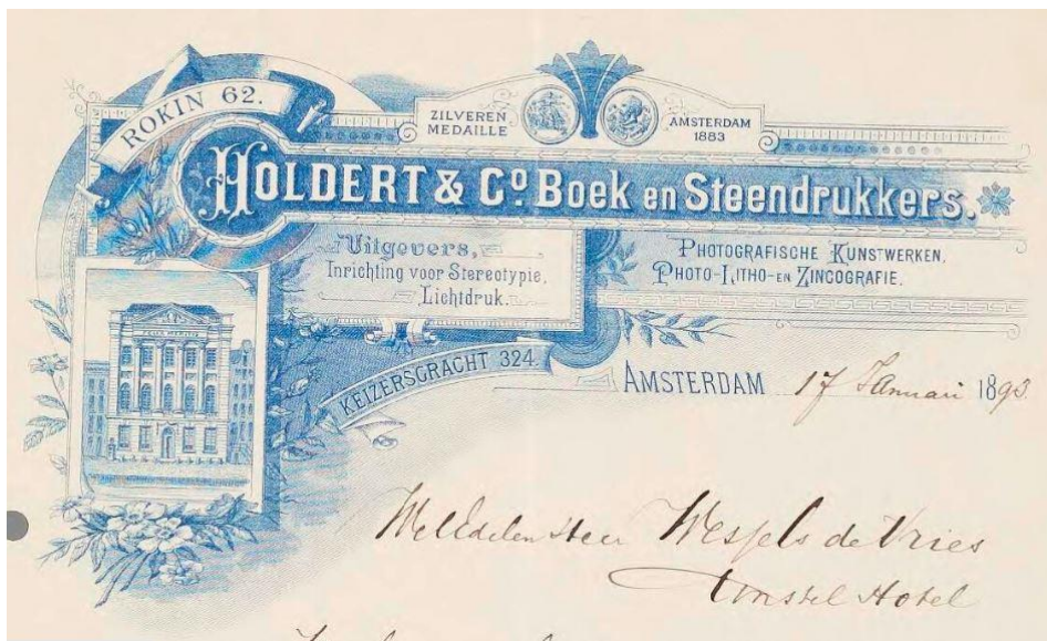
3. Briefhoofd Holdert & Co., Boek en Steendrukkers Amsterdam.

Er zijn twee series kaarten bekend, getekend door Peter Lem. De ene serie bestaat uit negen of meer kinderkaarten van de uitgeverij Allis, de andere serie bestaat uit kerst- en nieuwjaarskaarten, waarvan er zes bekend zijn. Deze kerst- en nieuwjaarskaarten zijn gesigneerd met P.LEM en met drie streepjes. De laatste is het symbool van Studio Drie. Over deze Studio zijn geen bijzonderheden bekend. De uitgever van deze serie is Drukkerij Van Ostade uit Amsterdam.