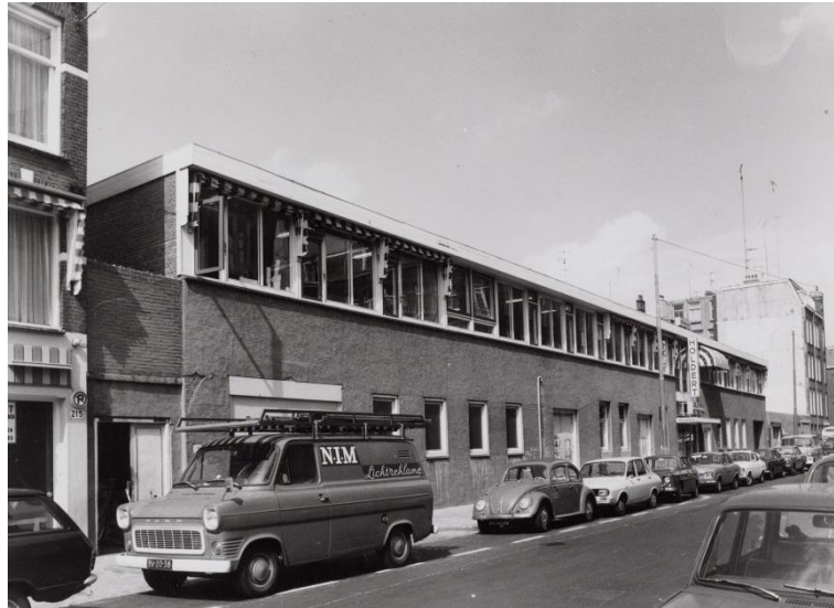
4. Bedrijfspann Holdert in de Van Ostadestraat.

geassocieerd worden met de pro-Duitse drukkerij Elsevier. Via de kantonrechter komt er een verbod op de naam Elsevier voor de drukkerij. Op 8 augustus 1945 houdt de naam Stoomdrukkerij Elsevier op te bestaan en wordt de naam Drukkerij Van Ostade. Later wijzigt deze naam in Holdert & Co. 5 Deze naam blijft tot een kraak in 1980 op de gevel staan. Daarna vestigt zich Drukkerij Raddraaier in de Van Ostadestraat 233. Drukkerij Raddraaier drukt hoofdzakelijk voor sociaal-culturele en politieke organisaties, kunstenaars, fotografen en Rietveldstudenten.