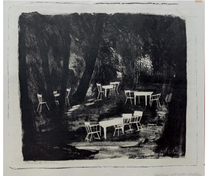
Cafétuin 't Bluk, Hilversum. Litho, spiegelbeeldig t.o.v. prentbriefkaart.