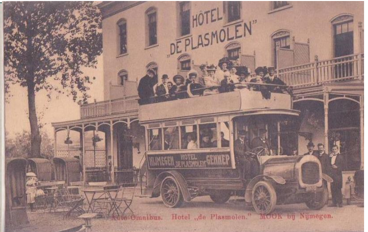
Hotel de Plasmolen, zwart-wit afgebeeld in krantenartikel.