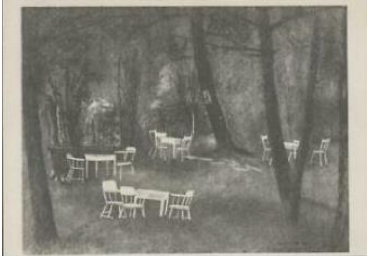
Cafétuin 't Bluk, Hilversum. Prentbriefkaart van uitgeverij De Driehoek in 's-Graveland.