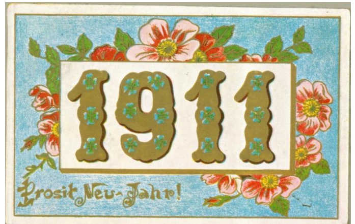
Duitse nieuwjaarskaart, afgebeeld in Drukkersweekblad.

Uit de beschrijvingen en afbeeldingen van kaarten in krantenartikelen die verschenen naar aanleiding van twee tentoonstellingen, ontstaat wel een beter beeld van de collectie. Van enkele kaarten is ook een afbeelding van de originele kaart gevonden. De collectie van Paul Citroen is zeer veelzijdig en per thema in albums opgeborgen. Stads en dorpsgezichten, strandgezichten, nieuwjaarskaarten, komische kaarten, koningshuis, geborduurde kaarten, zoekplaatjes, Eerste Wereldoorlog, romantiek, houd-tegen-het-licht-kaarten, compositiekaarten, gelegenheidskaarten, politieke kaarten, erotiek en kunstkaarten. Het lijkt erop dat er qua thematiek geen beperkingen waren. Je kunt alleen constateren dat “gewone” kaarten sterk in de minderheid zijn. In citaten van Paul Citroen valt ook vaak het woord kitsch ten aanzien van deze collectie.