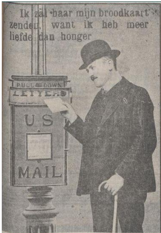
Ik zal haar mijn broodkaart geven, want ik heb meer liefde dan honger. Opschrift op Amerikaanse kaart.