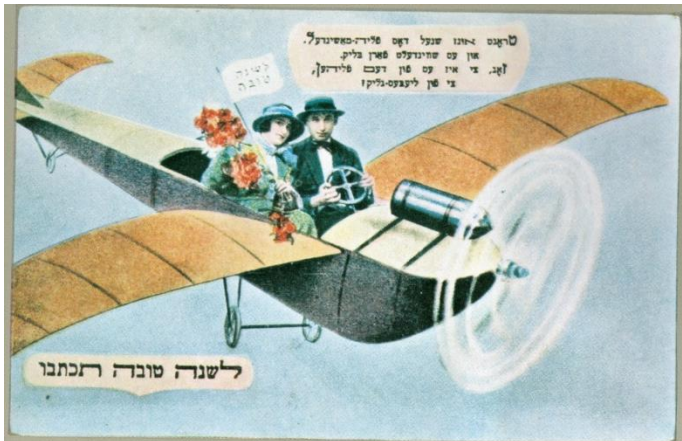
Joodse nieuwjaarskaart, afgebeeld in Drukkersweekblad.