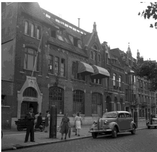
Pand van Kühn en Zoon in Rotterdam.

Op de posters gedrukt door Mouton staat de tekst: Lithography by Mouton Cy, The Hague. De drukkerij is gevestigd aan de Herderstraat 5 in Den Haag. In 1900 noemt de firma zich stoom- en snelpersdrukkerij en werkt in boekdruk, steendruk en koperdruk en aluminiumdruk. In 1914 gaat de drukkerij bankbiljetten drukken. Ook het drukken van affiches en plattegronden behoort tot de werkzaamheden. De periode van werkzaamheid strekte zich uit van 1884 tot 1970.