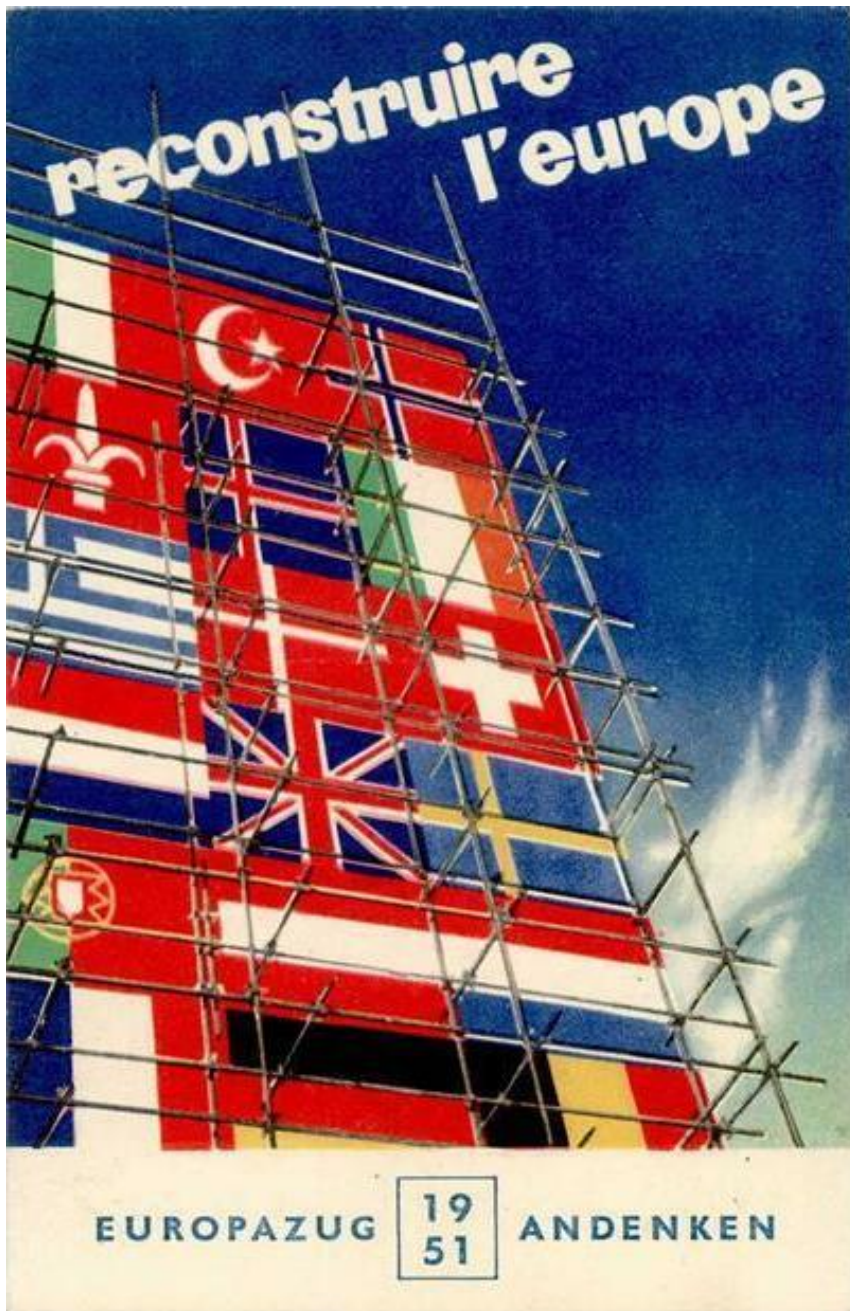
Poster van Alban Weiss op een Duitse prentbriefkaart.