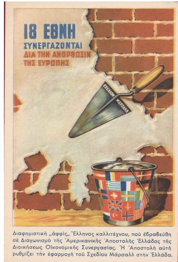
Grieks ontwerp voor een poster.