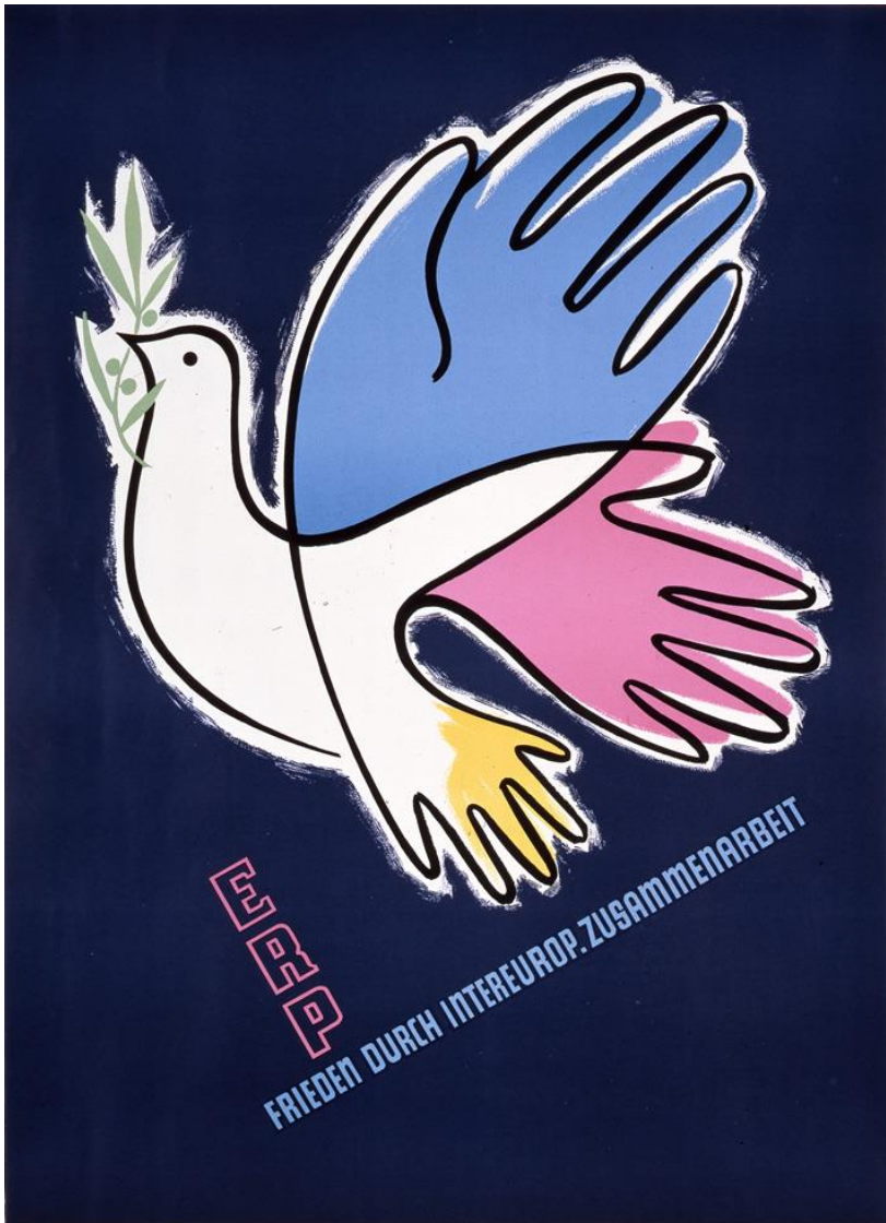
Poster van Ernest Storch, Oostenrijk.