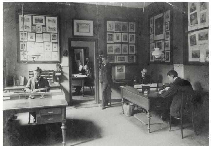
Kantoor van Mouton in Den Haag.