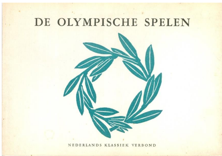
Voorzijde mapje De Olympische Spelen.