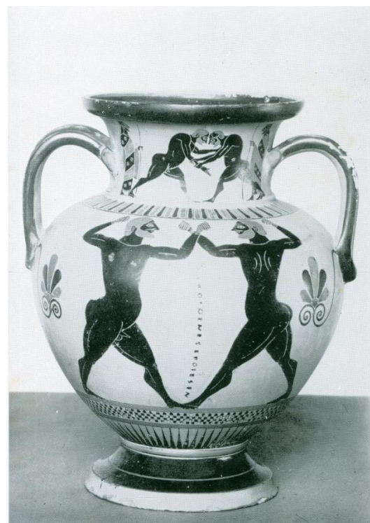
No. 7. Worstelen (boven), 2e helft 6e eeuw.