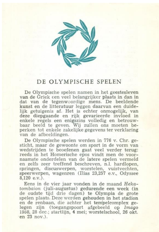
Toelichting in het mapje De Olympische Spelen

Bovenstaand bericht verscheen op 11 maart 1960 in het Algemeen Handelsblad.