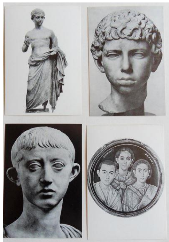
Kinderportretten, kaarten No. 9, 10, 11 en 12.