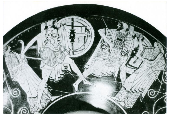
Mapje 1966. Menelaus en Paris. No. 2.