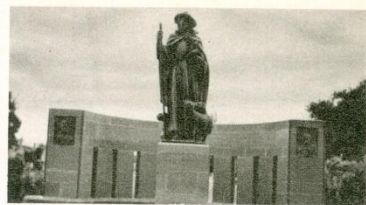
V. Rooyen Monument - 's Heerenberg