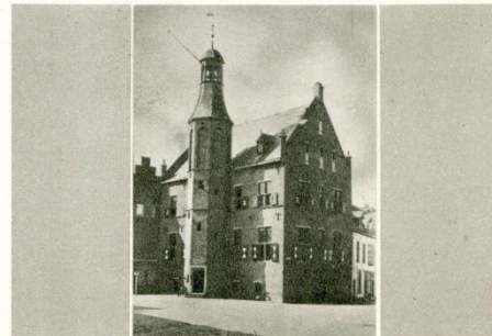
Raadhuis - 's Heerenberg

's Heerenberg was vroeger de Residentie der Graven van Bergh, het aanzienlijke geslacht, ons bekend uit de Vaderlandse geschiedenis. Het stamhuis der Graven, het Kasteel Bergh, is nog geheel in de oude trant blijven staan. Naast vele bezienswaardige oude gebouwen, zoals de Boetselaersburgh, de Ned. Herv. Kerk enz., is reeds de naaste omgeving van het kasteel rijk aan natuurschoon; de voormalige vestingwallen met eeuwenoud geboomte en de z.g. Plantage bieden de natuurliefhebber rijke wandelingen. 's Heerenberg ligt direct aan de Duitse grens.