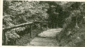
Rustieke Trap Montferland - 's Heerenberg