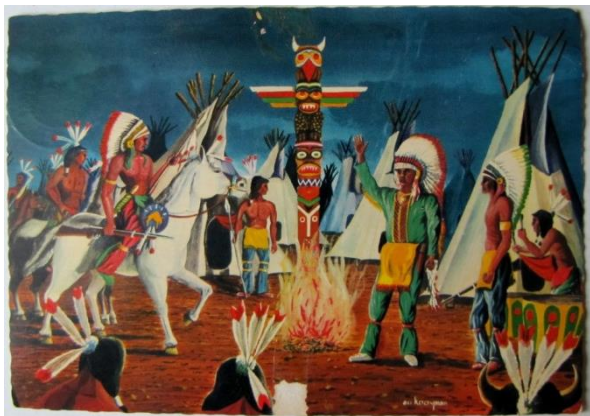
2. Indianen bespreken "plan de campagne".