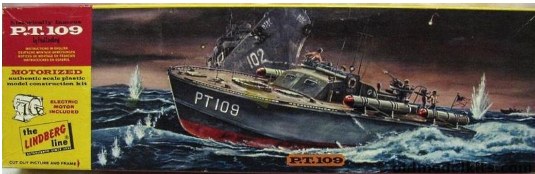
8. Illustratie voor de verpakking van een modelbouw-boat. The Lindberg Line, 1963.

In 1967 bracht de uitgever Mulder & Zoon N.V. uit Amsterdam boeken uit van de illustrator A.O. Kooyman. Bekend zijn: “Mijn boek over treinen en vliegtuigen” en “Mijn boek over zeil- en zeeschepen”. De boeken zijn ook voor de Amerikaanse markt verschenen, uitgegeven door de Educational Reading Service of Mahwah, New Jersey in 1970 en door Bancroft in Londen. Het copyright berust bij Mulder & Zoon N.V., Amsterdam en ze zijn gedrukt in Nederland. Bekend zijn: “My super book of planes in colour”, “My super book of racing cars in colour”, “My super book of trains in colour” (uitgave 1968, Bancroft & Co., Londen) en “My super book of boats and ships in colour” (1967, Bancroft).