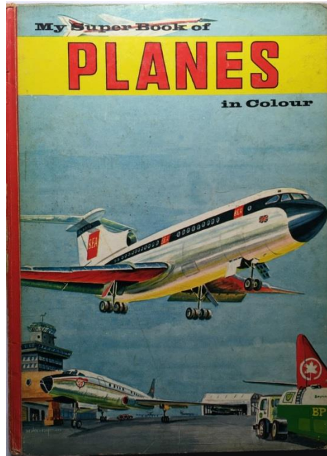
7. My super book of planes in colour.

In 1967 bracht de uitgever Mulder & Zoon N.V. uit Amsterdam boeken uit van de illustrator A.O. Kooyman. Bekend zijn: “Mijn boek over treinen en vliegtuigen” en “Mijn boek over zeil- en zeeschepen”. De boeken zijn ook voor de Amerikaanse markt verschenen, uitgegeven door de Educational Reading Service of Mahwah, New Jersey in 1970 en door Bancroft in Londen. Het copyright berust bij Mulder & Zoon N.V., Amsterdam en ze zijn gedrukt in Nederland. Bekend zijn: “My super book of planes in colour”, “My super book of racing cars in colour”, “My super book of trains in colour” (uitgave 1968, Bancroft & Co., Londen) en “My super book of boats and ships in colour” (1967, Bancroft).