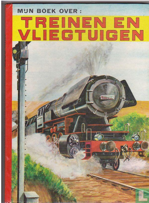
6. Mijn boek over treinen en vliegtuigen.