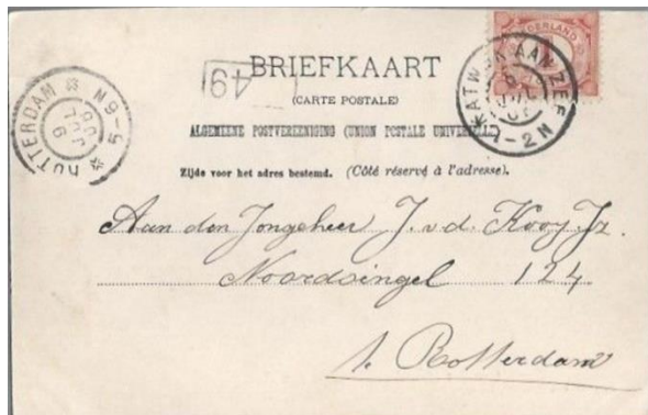
Uitg. G. van Egmond, Katwijk.