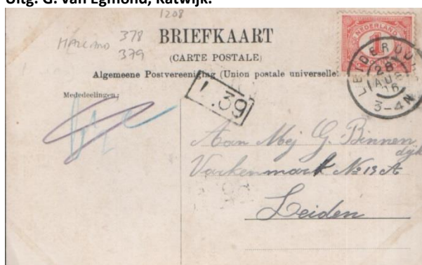
Uitg. G. van Egmond, Katwijk.