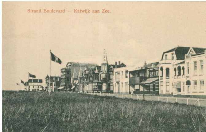
Strand Boulevard – Katwijk aan Zee.