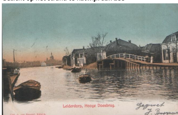
Leiderdorp, Hooge Doesbrug.