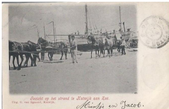
Gezicht op het strand te Katwijk aan Zee