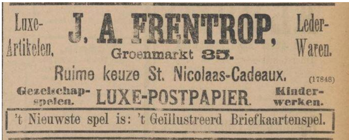
Advertentie in Het Vaderland van 30 november 1899 van de kantoorboekhandel J.A. Frentrop..

Bij J.A. Frentrop aan de Groenmarkt in Den Haag was een Geïllustreerd Briefkaartenspel te koop. Het is niet bekend hoe dat spel er uit ziet, maar mogelijk had het enige gelijkenis met een Engels briefkaartenspel.