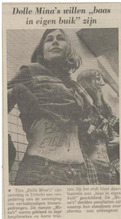
Bericht in het Algemeen Handelsblad van 16 maart 1970