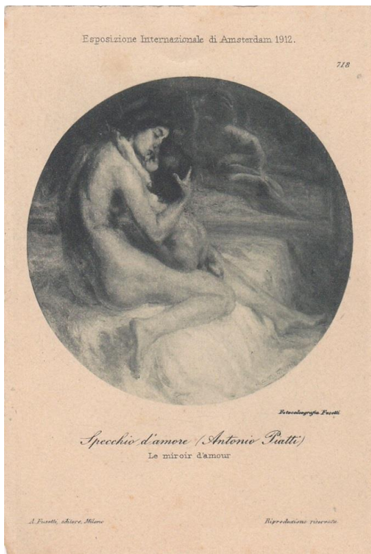
Specchio d'amore / Le Miroir d'amour. Antonio Piatti.