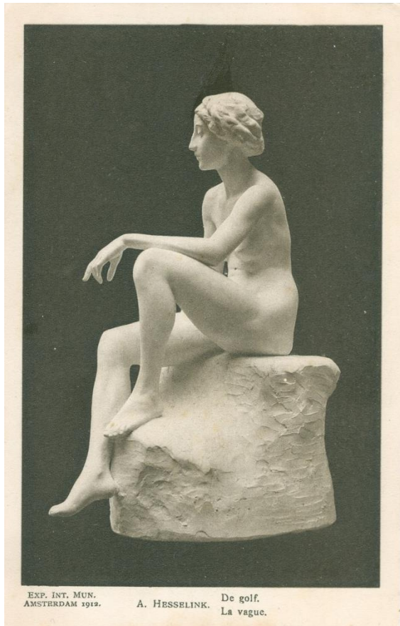
A. Hesselink. De Golf. Exp. Int. Mun. Amsterdam 1912.

Sommige delen van mijn verzameling groeien zeer langzaam. Zo ook de kaarten van de tentoonstelling in het Stedelijk Museum, waarvan er tot nu toe, maar 15 bekend zijn. Ze zijn niet duur en niet in kleine oplagen gedrukt. Er is echter weinig vraag naar deze kaarten, waardoor er ook weinig wordt aangeboden.