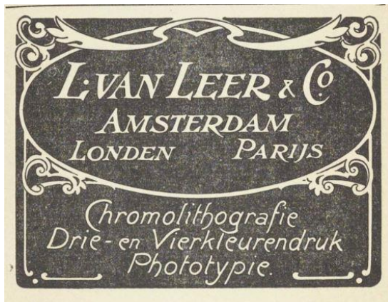
Advertentie van L. van Lee in Catalogus.

Totaal zijn 100 foto's van kunstwerken in de catalogus van 1912 opgenomen. Alle kunstwerken die bekend zijn van prentbriefkaarten, zijn ook afgebeeld in de catalogus. Waarschijnlijk zijn dezelfde foto's zowel gebruikt voor catalogus en kaarten. Het is onbekend hoeveel kaarten de serie omvat, een aantal van 100 lijkt mij commercieel gezien niet zo aantrekkelijk. De kaart zelf geeft weinig of geen informatie over drukker of tentoonstelling. Op de beeldzijde staat op de onderste witte rand de naam van de kunstenaar en de titel in het Nederlands en het Frans. Er was eveneens een Nederlandstalige en een Franstalige catalogus. Op een geschikte plaats op de foto of op de rand staat de afkorting EXP. INT. MUN. AMSTERDAM 1912. Het is onbekend welke drukker de kaarten heeft gedrukt. De catalogus is mogelijk gedrukt door Van Leer in Amsterdam, want van deze drukker staat een advertentie achter in de catalogus. Mogelijk heeft Van Leer ook deze kaarten gedrukt, want er zijn meer tentoonstellings- en museumkaarten die door Van Leer gedrukt zijn.